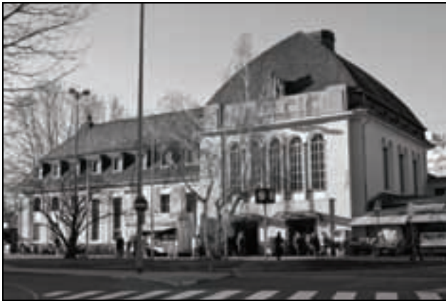
Bahnhof Höchst

schlag von PRO BAHN, die Straßenbahn bis in den Bahnhof selbst zu verlängern. „Mer braache die Trambahn net“, mussten sich PRO-BAHN-Vertreter bei den Aktionstagen öfters anhören. Zugegeben, die Umsetzung unseres Vorschlags muss nicht gleich heute geschehen und er sollte auf keinen Fall den Zeitplan der versprochenen Umbaumaßnahmen gefährden. Aber wenigstens die Option für eine Straßenbahnverlängerung sollte man sich für die Zeit offen halten, in der wieder genügend Gelder für den öffentlichen Nahverkehr zur Verfügung stehen.