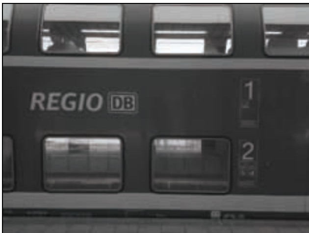
Erste Klasse im Doppelstockwagen.

Dagegen herrscht in den Abteilen der 2. Klasse oft drangvolle Enge, manchmal reichen die Stehplätze kaum aus. Dies gilt insbesondere dann, wenn bei einem Drei-Wagen-Zug auch noch ein Wagen abgesperrt wird. Der RMV sagte keine Abhilfe zu, da eine Änderung der Wagenaufteilung nicht möglich sei.