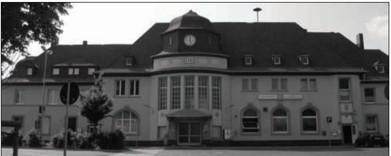
Großer Bahnhof in Alsfeld: Das Empfangsgebäude der oberhessischen Kleinstadt – gebaut, als hier große Ost-West-Verbindungen geplant waren.

Die Verkehrsplaner haben sich letztendlich für einen durchgängigen Taktverkehr von nur noch Regionalbahnen mit Halt an allen (verbleibenden) Stationen – wie es sich übrigens auf der RheingauLinie bewährt hat – entschieden. Der Mischbetrieb von RE- und RB-Zügen wird also aufgegeben, nicht zuletzt deshalb, weil er keine saubere Taktanbindung von Zubringerbussen in den jeweiligen Unterzentren erlaubt und bestimmte Halte benachteiligt.