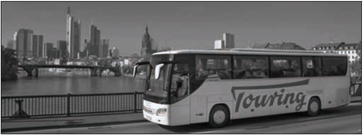
Bus der Deutsche Touring vor der Frankfurt Skyline.