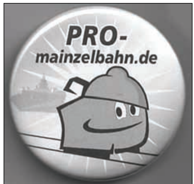
Button für das neue Straßenbahnprojekt