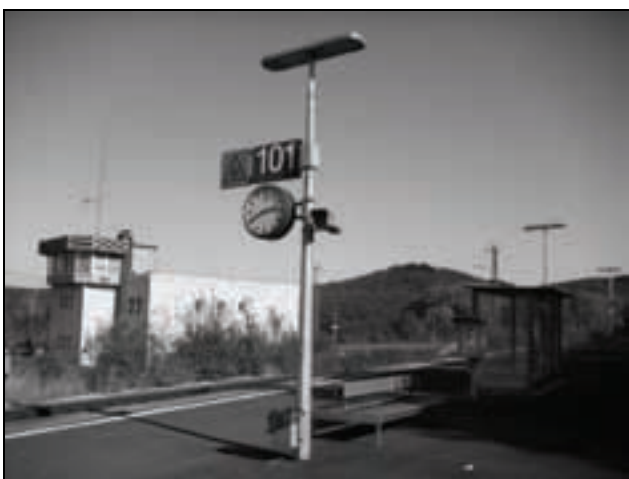
Gleis 101 in Haiger – hier endet der Rhein-Main Verkehrsverbund.

Die Betreiber (HLB und DB Regio) erhalten von den Verbänden ihre vertraglich vereinbarten Betriebskosten in voller Höhe erstattet, gleich, wie viele Personen im Zug mitfahren. Und tagsüber sind die Züge oft nur zu rund 30 Prozent besetzt. Hier schmerzt also jeder fehlende Fahrgast besonders. Jede nicht verkaufte Fahrkarte führt zu einem niedrigeren Deckungsgrad der Linie. Die Differenz zwischen den Fixkosten und den geringeren Fahrgeldeinnahmen übernimmt wohl oder übel der Steuerzahler.