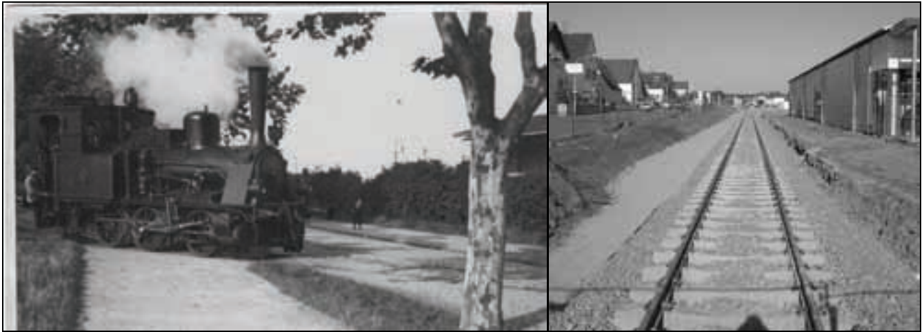
Dampflok in Pfungstadt 1914 und aktuelle Bauarbeiten zur Wiederinbetriebnahme der Strecke im Frühjahr 2011.