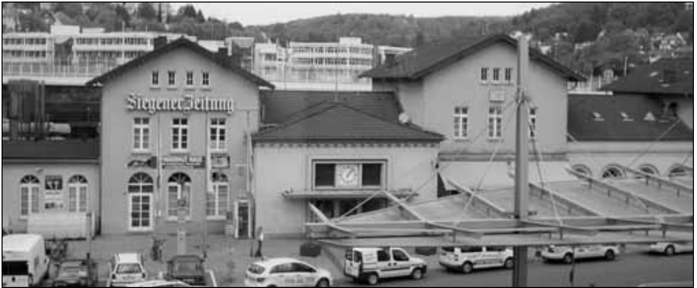
Dreh- und Angelpunkt zwischen Mittelhessen und dem Ruhrgebiet: Der Bahnhof Siegen.