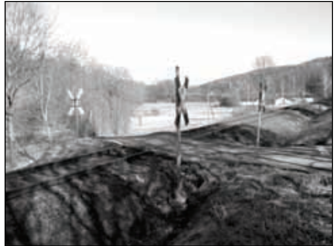
Ungesicherter Bahnübergang in Hettenhausen

Das Ergebnis war jedoch ernüchternd. Seit 2004 gilt eine neue Richtlinie für die Sicherung von Bahnübergängen. Das bedeutet: Wäre der Bahnübergang im Zuge des Rhönbahnvertrages ausgebaut worden, wäre noch eine Sicherung mit einer Lichtzeichenanlage möglich gewesen. Das geht jetzt nicht mehr so ohne Weiteres.