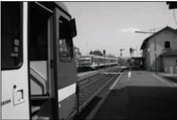
Zugkreuzung in Reiskirchen.

Bahnsteigen zu vielen Fernzielen bei zumutbarer Umsteigezeit gegeben sind. Als Betriebszeit der Vogelsbergbahn ist montags bis freitags von ca. 5.00 Uhr bis ca. 22.00 Uhr, an Samstagen ist ein Zugpaar abends anstelle der jeweils ersten Fahrt ab Gießen bzw. Fulda vorgesehen, an Sonn- und Feiertagen verkehren die Züge ähnlich wie heute.