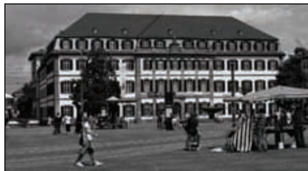
Regierungspräsidium in Darmstadt

Weiterhin heißt es im Bericht des Bundesverkehrsministeriums: „Der weiterhin bestehende Optimierungsbedarf konnte im Rahmen der Bedarfsplanüberprüfung nicht geleistet werden. Hierzu ist vielmehr eine Zusammenarbeit mit den betreffenden Gebietskörperschaften bzw. den Aufgabenträgern des SPNV (Schienen-Personen-Nahverkehr) erforderlich.“