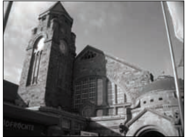
Bahnhof Gießen

Die einfachste Lösung wäre es, wenn als Beispiel die Leistungen der Hessischen Landesbahn auf dem Main-Lahn-Sieg-Netz (1,2 Mio. km) auf bestimmte Teile des MittelhessenExpress (zusammen 3,1 Mio. km) übertragen würden. Im „Gegenzug“ könnte DB Regio als Kompensation wieder durchgehende Züge, ggf. sogar, als Ersatz für die nichtverfügbaren Talent2, mit modernen Doppelstock-Elektrotriebwagen der Baureihe KISS, auf der dann wieder durchgängigen Strecke Frankfurt – Gießen – Siegen – Köln – Aachen einsetzen.