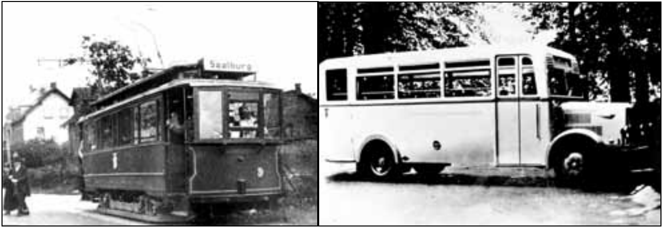
Schon lange Historie: Bahn und Bus zur Saalburg