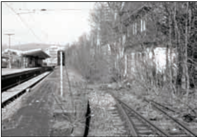
Gleis 1 in Bad Homburg (rechts)

Aus diesen Gründen verständigte sich die Mehrheit des Stadtparlaments auf eine neue Lösung. Die Planung sieht vor: Die Stadtbahnstrecke wird um 1.600 Meter verlängert; sie soll von der jetzigen Endstation Gonzenheim, die man unter die Erde legen will, ebenfalls unterirdisch der Frankfurter Landstraße etwa 350 Meter bis zur Unterquerung der Bahnstrecke Bad Homburg – Friedrichsdorf folgen. An deren Nordseite wird sie auf das Niveau der S-Bahntrasse ansteigen und parallel zu dieser den Bahnhof erreichen; dabei ist ein etwa 300 Meter langer, eingleisiger Abschnitt vorgesehen.