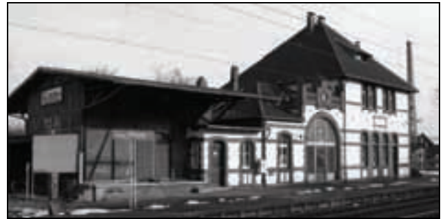
Kein Klo im Bahnhof Hümme

Was den RegioTram-Fahrern seit Jahren zugemutet wird, ist unglaublich: übel riechende Hinterlassenschaften, keine Heizung, kein fließendes Wasser. Die Beschwerden der Fahrer blieben jahrelang ungehört. Es ist gut, dass die Betroffenen nun an die Öffentlichkeit gegangen sind, das Thema endlich ernst genommen und Abhilfe geschaffen wird. Behelfsklos haben allenfalls auf Baustellen ihre Berechtigung. Als Dauereinrichtung im öffentlichen Raum sind sie eine Schande. (hh)