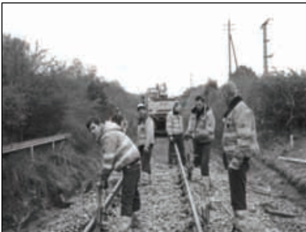
Bauarbeiten an der Vogelsbergbahn.

Danach hat der RMV den Betrieb der Vogelsbergbahn zusammen mit dem Betrieb der Lahntalbahn zwischen Gießen und Limburg und der Rhönbahn als Bündel europaweit ausgeschrieben. Die Hessische Landesbahn hat das Los, wie von Insidern erwartet, für sich entscheiden können und wird ab Dezember 2011 26 fabrikneue Fahrzeuge vom Typ LINT 41 und 27 auf die Gleise der Vogelsbergbahn stellen. Die Triebwagen sind gegenüber den bisher ausgelieferten Triebwagen – bedingt durch die Topografie der Strecke und dem Fahrzeitgewinn von 20 Minuten – deutlich stärker motorisiert. Damit in der Ferienzeit und an Wochenenden mehr Fahrräder mitgenommen werden können, können einige Sitzreihen leicht entfernt werden. Außerdem ist geplant, an Tagen mit zu erwartetem großen Ausflugsverkehr in Doppeltraktion zu fahren. Man darf gespannt sein, inwieweit diesen Ankündigungen auch entsprechende Taten folgen.